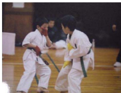
大接戦！タッチ組手