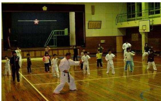
12.16 腹赤小学校体育館で小演武会を行いました

Students came from across Ontario to attend the clinic, including Barrie, Belleville, Chesley and Warton.