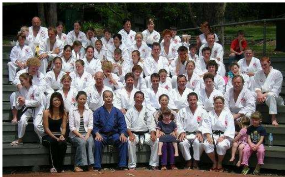
いろいろな指導体験ができたキャンプ

色帯クラスの2日目は、練歩初段の指導。 基本的な突き / 受け / 蹴り / 立ち / 半月歩法の