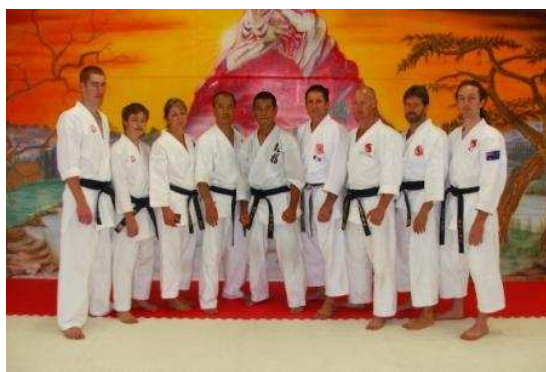
有段者との早朝稽古を終えて（道場にて）

私は以前「自分たちの求める魅力ある真の空手道とは？」「そんな一生涯を通して修業できる空手道があるのか？あるとすれば、それはどこに？」と暗中模索する時期がありました。前回カナダ・アメリカへ行った時もそうですが、今回も私と同じような境遇に直面している人達がオーストラリアにもいたのです。