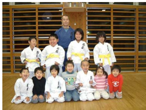
練習頑張ってまーす（熊本桜山道場）